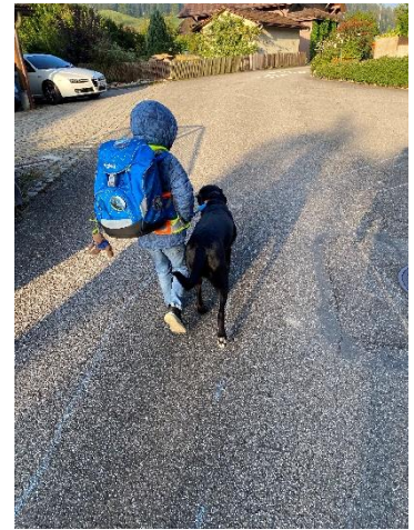
Begleitung in die Schule