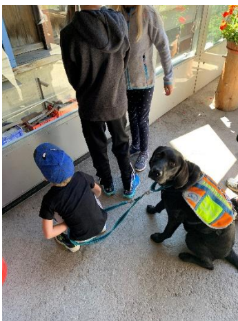
Begleitung bei Ausflügen